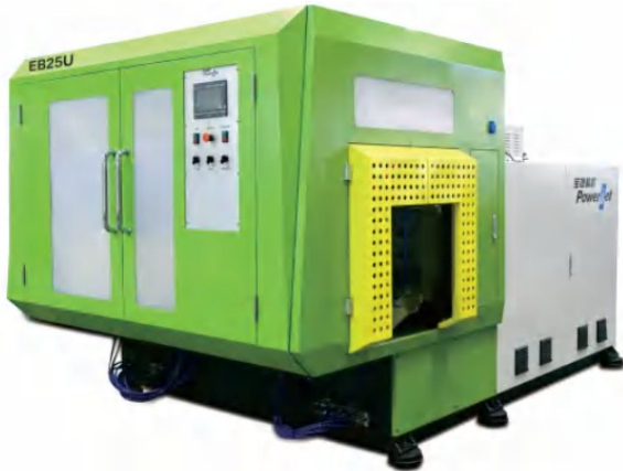
Modellek: EB50U75S | EB50U85S | EB50U75-25SV | EB50U75-45D

Max. terméktérfogat: ≤ 5 L Záróerő: 140 kN HDPE kapacitás: 80–120 kg/h