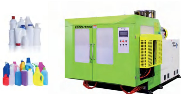
Modellek: EB25H55S | EB25H65S | EB25H65-40D | EB25H70S

Max. terméktérfogat: ≤ 2,5 L Záróerő: 53–63 kN HDPE kapacitás: 35–65 kg/h