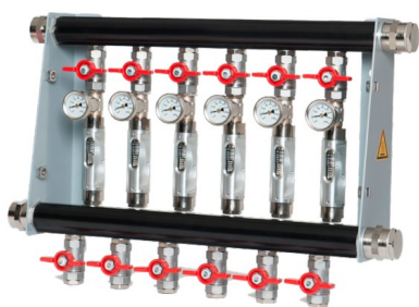
RWFR 160 (max. 160°C)

Magas hőmérsékletű modellek és elektronikus sorozat