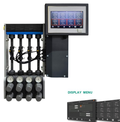
EWFR – elektronikus, 7" kijelző