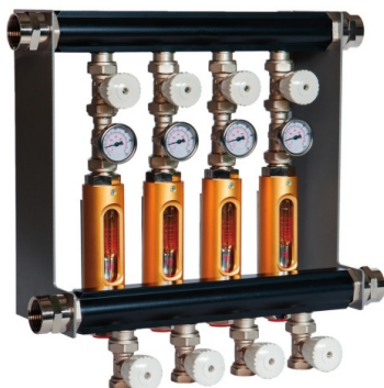
RWFR 120 (max. 120°C)