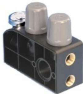
WFR – ZS (Ø12 mm) és ZR (3/8") kivitel